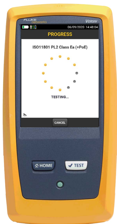
Doppia firma PoE

Nel nuovo mondo degli edifici intelligenti, il numero di dispositivi che saranno collegati e alimentati via IP crescerà in modo esponenziale guidato da nuovi sviluppi come l'illuminazione a LED tramite il soffitto IP digitale.